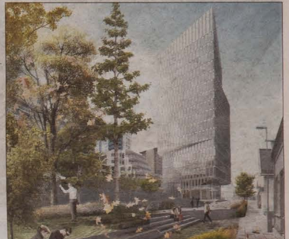
BLOKKEN: Planene, slik de presenteres av Base Gruppen og Schmidt Hammer Lassen Architects.