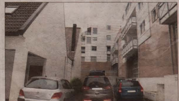
TETT: I forslaget fra Base Gruppen legges det opp til bygging på linje med dagens kirkebygg. Til høyre boliger i St. Olav 2 og 4.