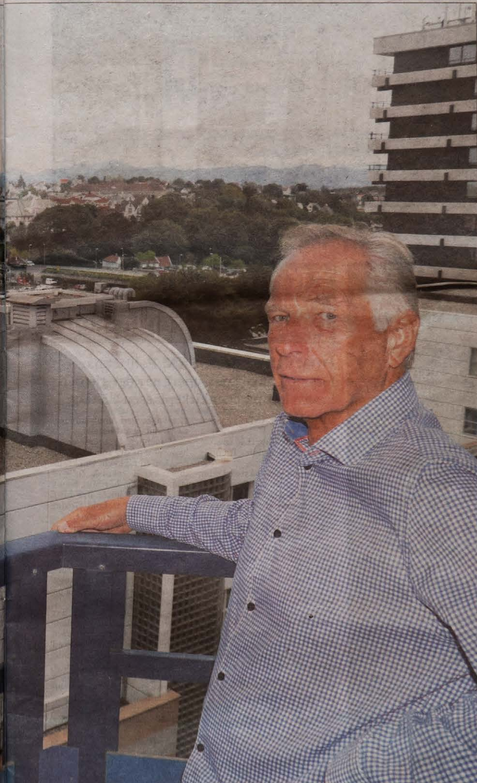
blokken til Base Property kan bli høyere enn dagens St. Olav-blokker.