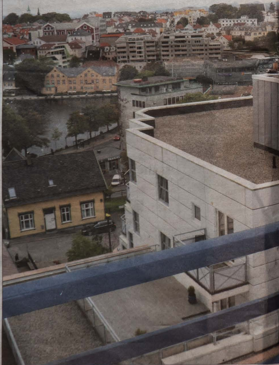
FRYKTER VEGG MOT ØST: Styremedlem Egil Thomsen på sin balkong i 5. etasje i St. Olavs gate nr. 7. Kontorblokk